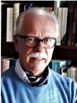
Voorzitter mr. Arie Slob